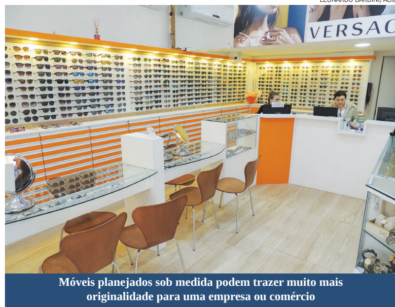
Móveis planejados sob medida podem trazer muito mais originalidade para uma empresa ou comércio

Com móveis planejados sob medida é possível sair da “mesmice” na hora da decoração, trazendo mais personalidade ao cômodo, além de muitas vezes ser a solução para um espaço onde exige proporções diferenciadas de produtos.