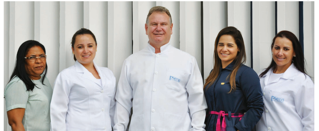
O Centro Odontológico Pleno conta com profissionais capacitados nas diferentes áreas da odontologia